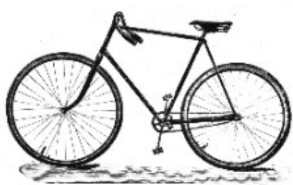
Afbeelding van een sportfiets (Archief)